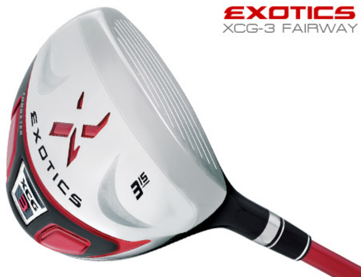
EXOTICS XCG-3 FAIRWAY

このクラブは、チタニウムカップフェース & クラウンとタングステンソールをコンボブレージング製法で結合しています。より低い重心にし、より深い重心化することで幅広い層のゴルファーにお使いいただけます。