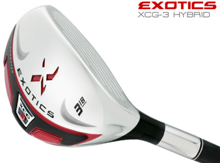
EXOTICS XCG-3 HYBRID

性能をさらに向上させるために、XCG-3 ハイブリッドは 2 つのウェイトパッドを内蔵しています。このパッドにより、純粋なエネルギー伝達、打音、打感、重心を最適化しています。アイアンでは味わえない安心感と安定性をお届けいたします。