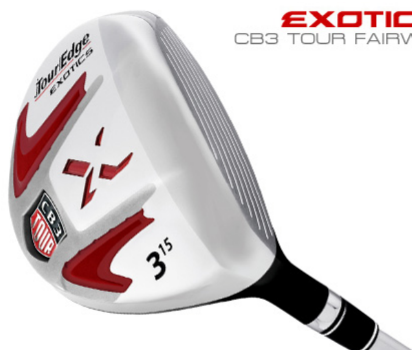
EXOTICS CB3 TOUR FAIRWAY

CB シリーズはコンポブレイジング製法で 2 つの異なる金属(溶接では接合できないチタニウムと鉄鋼)で形成されています。より最適な銃身位置にし、よりすばらしいスプリング効果を発揮させ、純粋なエネルギー伝達を可能にしました。